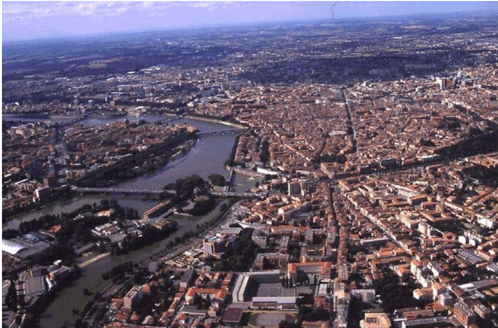
Toulouse : vue aérienne.

Avec la rénovation et la " mise au vert " de la Place Occitane, le centre ville prend des allures champêtres dans un quartier redynamisé.