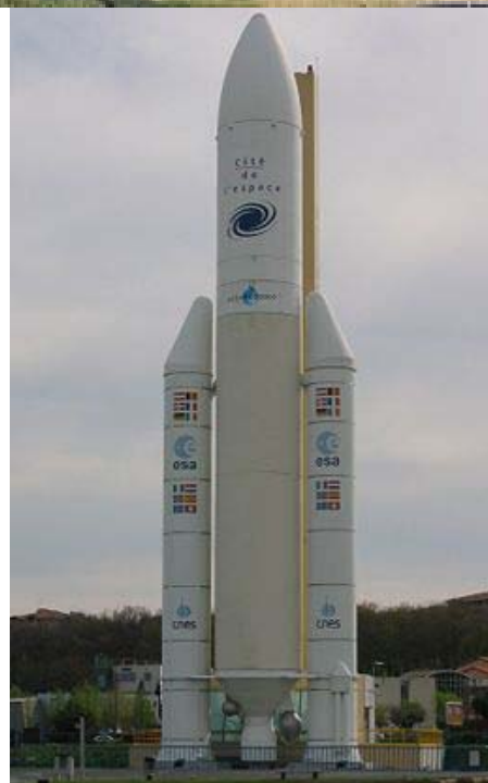
Maquette grandeur nature de la fusée Ariane 5