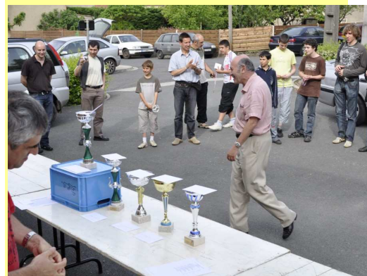
Remise des prix

Les chefs du tournoi rappellent à la population que le prochain Open Tarn Nord (homologué FIDE, classement <2200), aura lieu à Albi le dernier week-end de septembre. Qu'on se le dise !