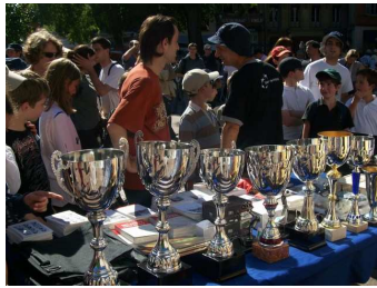
Remise des récompenses