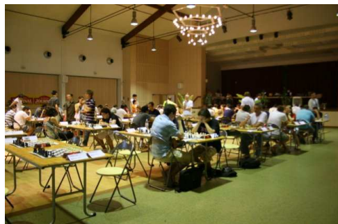
Vue sur la salle de jeu

nouveautés : le repas de midi servi sur le lieu même du tournoi (en salle d'analyse plus exactement) et un concert de bandas ! Vivement le 8 ème festival !