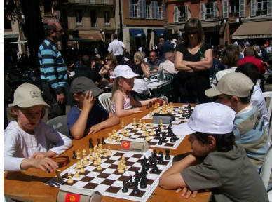
Les casquettes et les bobs étaient de rigueur.